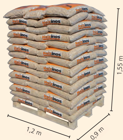
Bancale a perdere

In più viene regolarmente controllata la qualità dalla società "Holzforschung Austria".